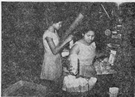
En pleno tren de trabajo fue captada esta fotografía, cuando la máquina pesadora inyectaba el aromático polvo de café en bolsas plásticas. De registrarse una falta aunque sea de centésimas, la máquina registra la falla y separa la bolsa. Así se garantiza el peso exacto del producto que sale de la fábrica de Café Triángulo

Estos vehículos, con el popular distintivo del "Triángulo" en sus costados, son también los heraldos que van pregonando la excelencia de un producto que es orgullo de nuestra Industria Nacional.