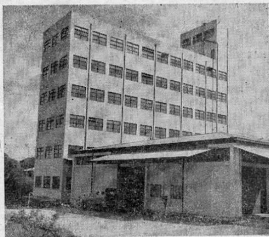
Moderno edificio en el que se encuentra instalado el molino de trigo del Consejo Nacional de Producción, que tiene capacidad para moler 25 tons. en 24 horas.