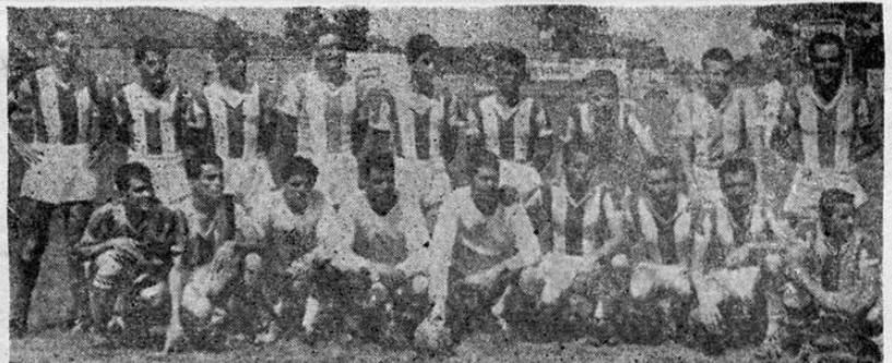
EL CLUB SPORT CARTAGINES, GLORIA Y HONRA DE LA PROVINCIA